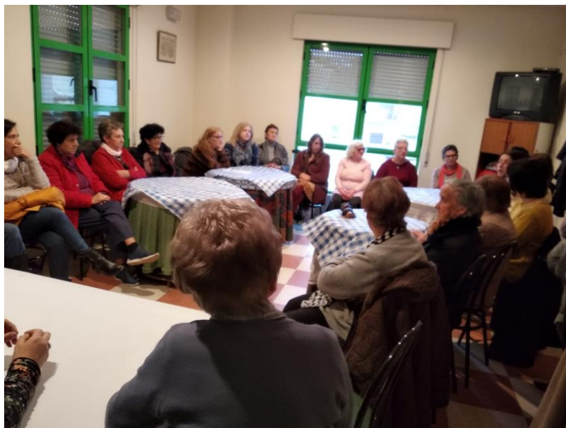
SESIÓN DEL TALLER DE EMPODERAMIENTO DE LA MUJER RURAL

“Un proyecto para un mundo rural cambiante”