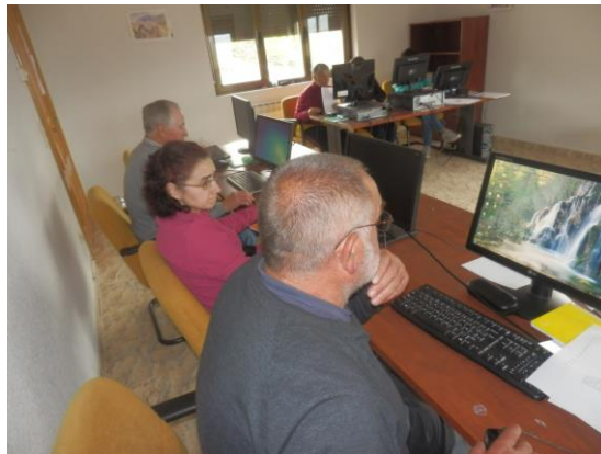
P. ACCESIBILIDAD A LAS NUEVAS TECNOLOGÍAS. CURSO INICIACIÓN INFORMÁTICA (BOHOYO)

Este programa pretende hacer frente a la denominada brecha digital de la comarca en cuanto al acceso y utilización de las denominadas TIC, por parte de los colectivos rurales que tienen una mayor dificultad de acceso a esta formación. Se han desarrollado dos acciones formativas: “Presentaciones Gráficas” (24 h.) e “Iniciación a la Informática” (28 h.) con la participación total de 18 personas. (-7 que en el programa anterior)