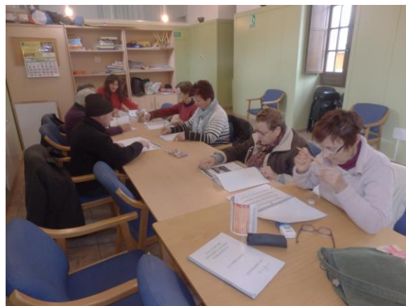
TALLER ESTIMULACIÓN COGNITIVA. LA HORCAJADA