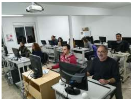
Curso Informática Básica (El Barco de Ávila)

Este programa pretende hacer frente a la denominada brecha digital de la comarca en cuanto al acceso y utilización de las denominadas TIC, por parte de los colectivos rurales que tienen una mayor dificultad de acceso a esta formación. Se ha impartido una acción formativa: “Iniciación a la Informática básica (24 h.) con la participación total de 12 personas.