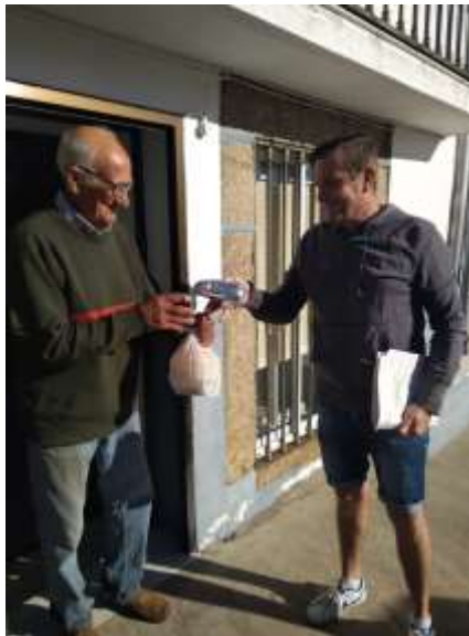
Suministro de comida a domicilio