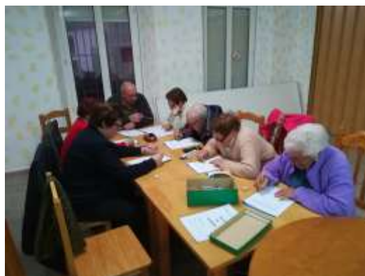
Taller estimulación cognitiva (La Carrera)