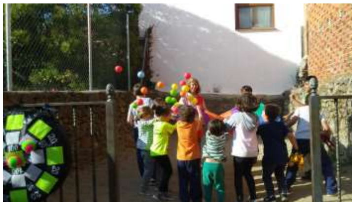
Ludoteca Infantil (El Barco de Ávila)