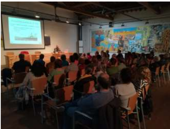
Actividad Formación Medioambiental

El objetivo se centra en estudiar cómo pueden convivir especies arbóreas diferentes formando bosques mixtos, y cómo van a regir estas dinámicas forestales.