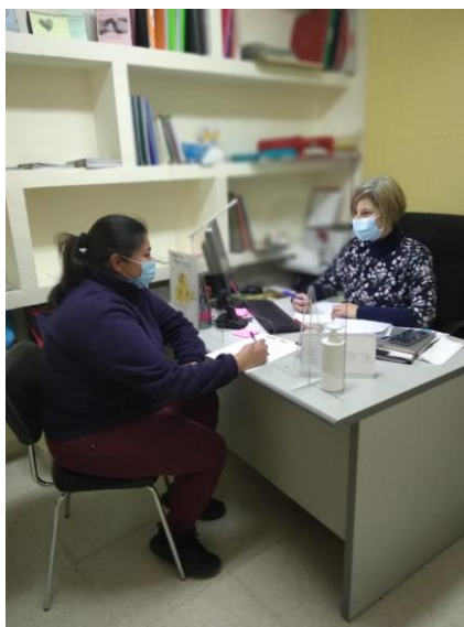
Bolsa de empleo (El Barco de Ávila)