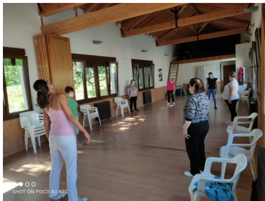
Taller Estimulación psicomotriz (Bohoyo)