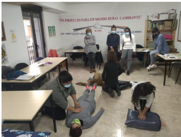
Sesión práctica: “Mejora de las capacidades físicas y primeros auxilios para las personas dependientes en el domicilio”

En el conjunto de los itinerarios llevados a cabo han participado un total de 57 personas