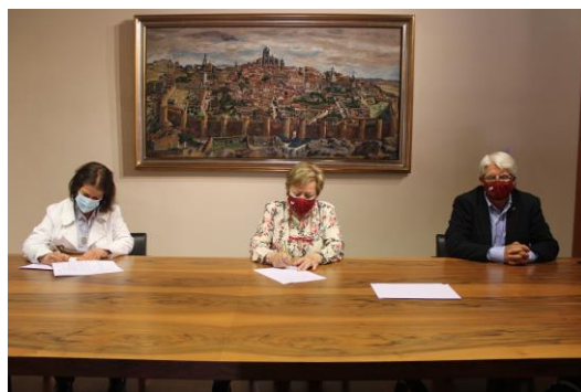
Firma convenio de colaboración CDR Almanzor-Fundación Ávila-Caixabank

Además se tiene firmado 1 convenio de colaboración con una entidad educativa (CRA El Calvitero).