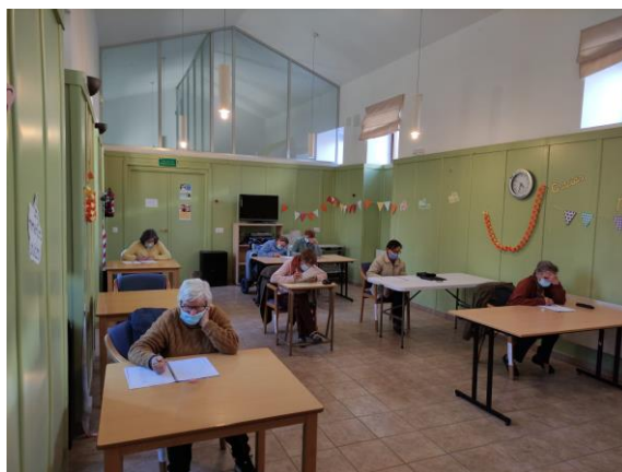
Taller estimulación cognitiva (La Horcajada)

A lo largo del año 2021 han participado 114 personas mayores en las diferentes actividades (+ 40 que en el año anterior).