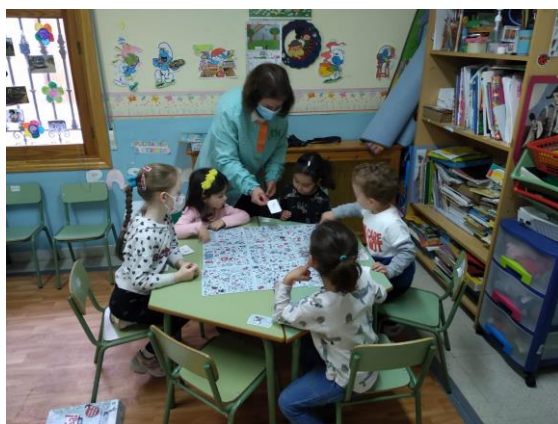
Ludoteca Infantil y Ed Primaria (El Barco de Ávila)