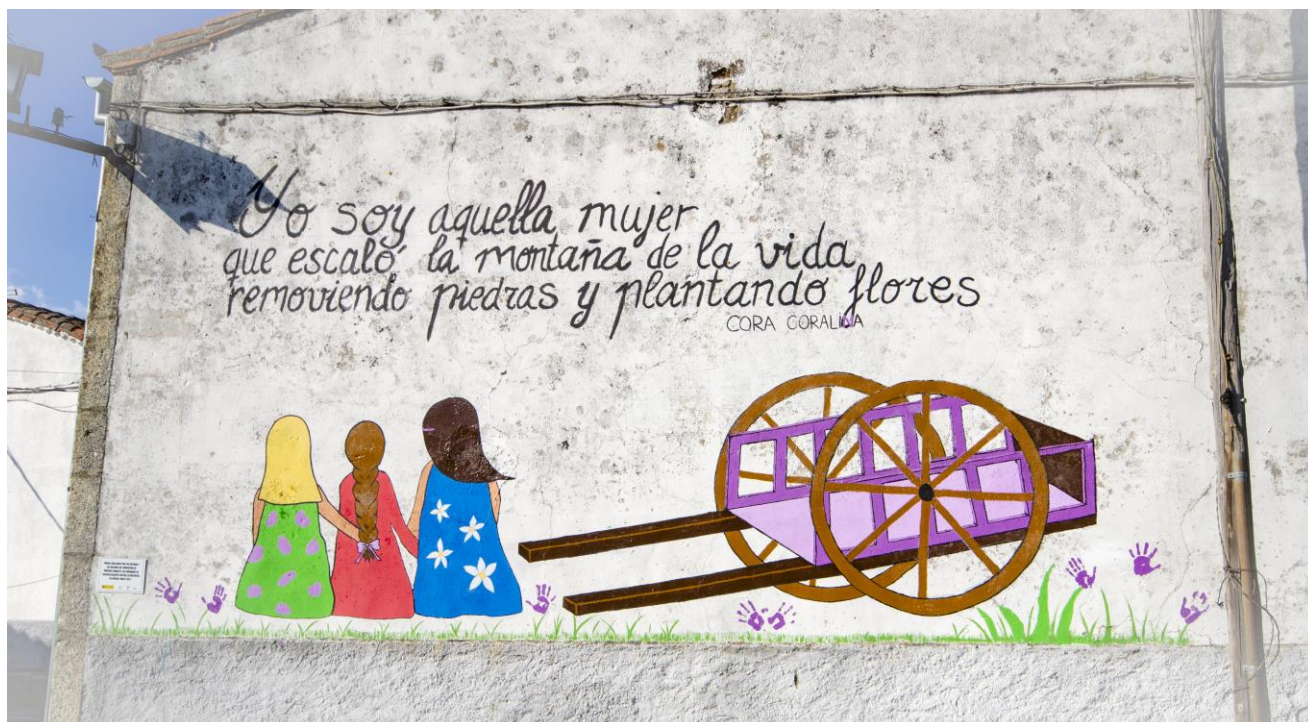
Mural elaborado por personas participantes: “Un mural contra la violencia de género” (Umbrias)

“Un proyecto para un mundo rural cambiante”