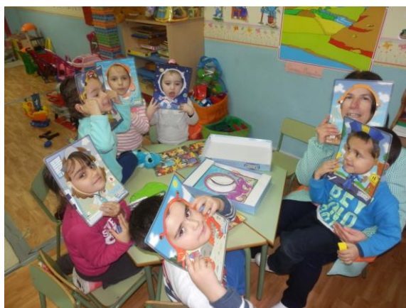
Ludoteca. Niños/as 3-8 años. El Barco de Ávila