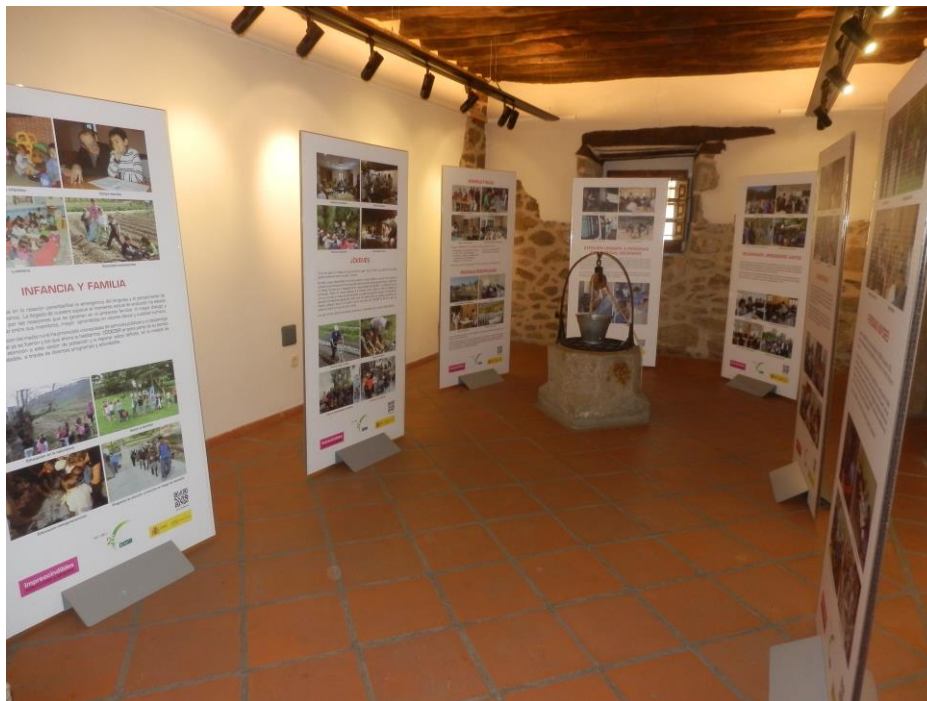
Vista Exposición XXV Aniversario constitución COCEDER. Antigua Cárcel (El Barco de Ávila)

“Un proyecto para un mundo rural cambiante”