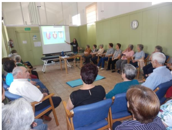
Atención Personas Mayores (La Horcajada). Sesión de formación