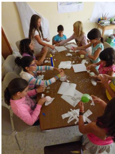
Reciclando (El Losar de Barco)