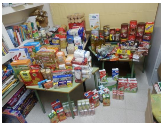
Algunos alimentos donados en la campaña

- Campaña “Litros de solidaridad: Durante la época estival se ha llevado a cabo una campaña de donación de alimentos no perecederos patrocinada por diferentes peñas y asociaciones locales de 5 localidades. En total se han recogido 332 Kg./litros que se han ido entregando junto a los vales de alimentos frescos. Además de forma permanente, diversas empresas locales han efectuado donación de alimentos no perecederos.