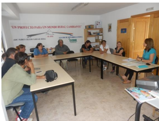
P. orientación e inserción sociolaboral. "Taller búsqueda empleo"