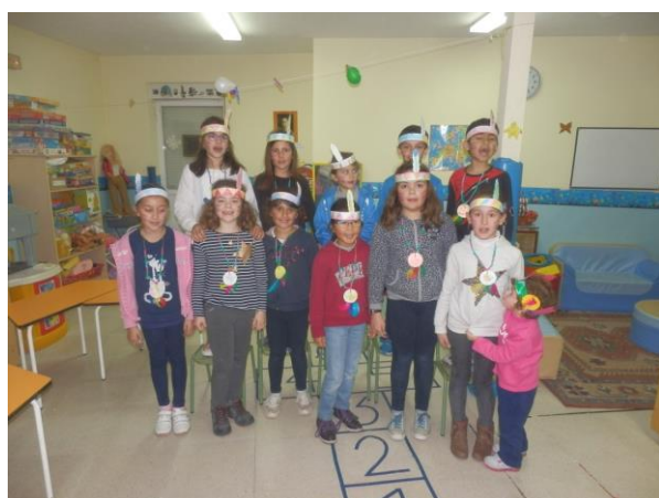
Ludoteca. "Taller de Carnaval"