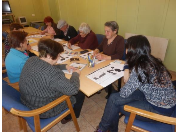
Taller estimulación cognitiva. C. Atención Personas Mayores (La Horcajada)