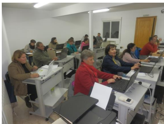
Programa de accesibilidad a nuevas tecnologías. Curso de “Gestión: Modulo ganadero”.

Este programa pretende hacer frente a la denominada brecha digital de la comarca, en cuanto al acceso y utilización de las denominadas TIC, por parte de los colectivos rurales que tienen una mayor dificultad de acceso a esta formación. Se han desarrollado dos acciones formativas: “Presentaciones Gráficas” y “Modulo: Gestión Ganadera” con la participación total de 25 personas.